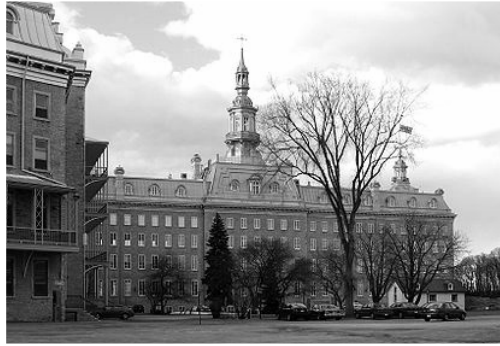
Квебекская семинария в наше время

Ко времени образования канадской федерации в 1867 году, в Канаде существовало 17 высших учебных заведений. Четыре из них - Торонто, Макгилл, Нью-Брансуик и Дальхаузи к тому времени приобрели светский характер, остальные же по-прежнему находились под