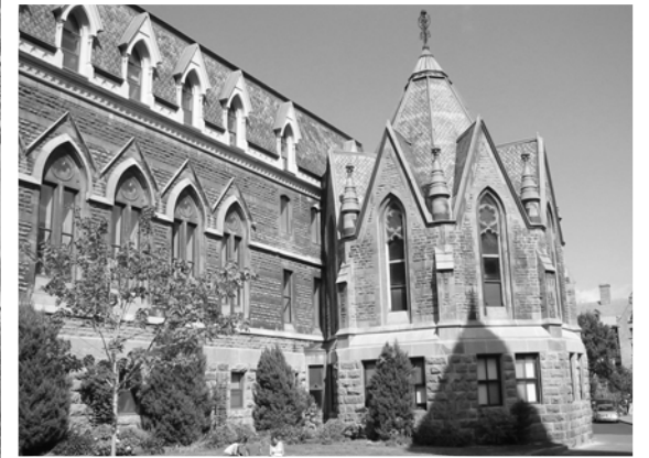
Университет Макгилл, Монреаль

К началу 60-х годов количество студентов в Канаде выросло в четыре раза по сравнению с 1939 годом. Главной причиной этого роста стал послевоенный взлет рождаемости (baby boom). Провинциальные правительства вынуждены были оставить прежние попытки удовлетворить бурно растущий спрос на высшее образование за счет расширения уже существующих университетов и сделали ставку на открытие новых вузов. В ряде случаев региональные отделения крупных университетов превратились в самостоятельные