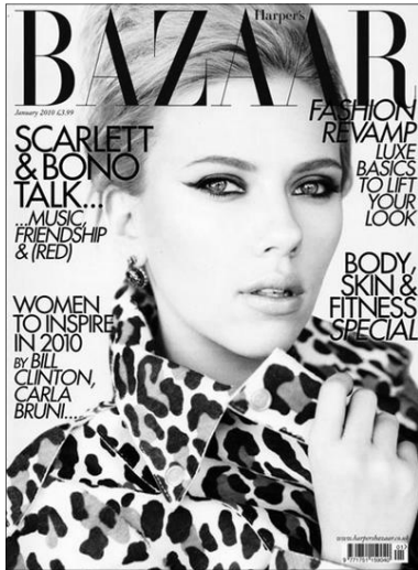
Мода в журналах

ный шок. В интернете полно высказываний типа: «Девушки, не одевайтесь слишком ярко, это вульгарно!» Девушки, как правило, отвечают: «А вы зато одеты, как серые мыши!»).