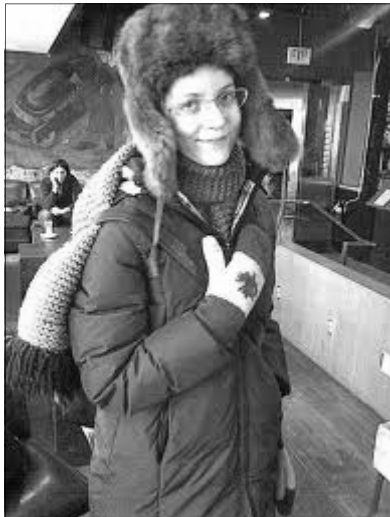
Мода на улицах

В декабрьском номере журнала Elle Canada за прошлый год я нашла статью «В погоне за стилем» Дэвида Ливингстона, где автор пытается понять отношение канадцев к моде. «Традиционно, – пишет автор, – мы гордимся тем, что не любим «show off» (что на русский язык можно перевести, как «не выпендриваемся»). Действительно, первые европейские эмигранты привезли с собой одежду неброских тусклых цветов и презрение к моде. Когда нужно заботиться о выживании, покроя платья не входит в число приоритетов. На триста лет позже никто уже не экономит на одежде, да и религиозные нормы не так строги, но... отношение к стилю изменилось на удивление мало. Добавьте к этому принципы «равноправия», которые с малых лет знают все канадки, и вот что получится (результат трехлетних