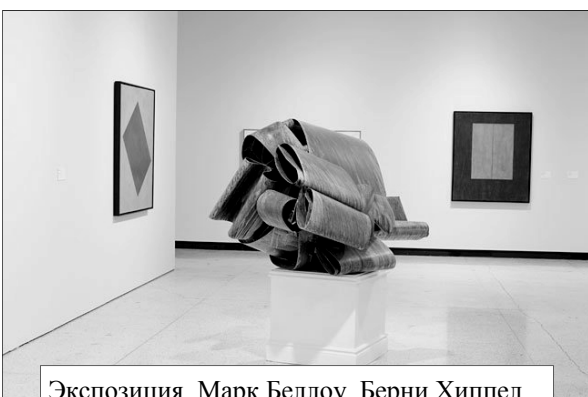
Экспозиция. Марк Беллоу. Берни Хиппел.