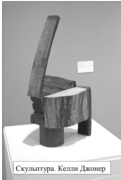
Скульптура. Келли Джонер

Некоторое время назад я попала на выставку Общества современного искусства Эдмонта, о чем и хочу рассказать. Общество существует уже 18 лет и насчитывает более 40 художников. Экспозиция, о которой я пишу, отражает уже сложившийся «современный» стиль, где преобладает абстрактное искусство. Мнения об этом направлении живописи могут быть совершенно разными, от восторга до полного неприятия. Мне интересно было посмотреть, что представляет собой абстракционизм в Канаде,